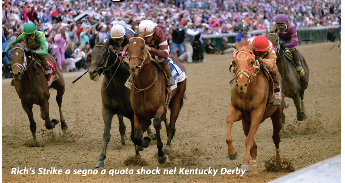
Rich's Strike a segno a quota shock nel Kentucky Derby