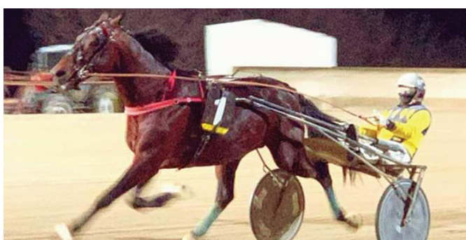
ZODIACO DORIAL, uno dei possibili protagonisti della TQQ odierna

Nardo a causa di problemi respiratori, ma se si esprimesse sui livelli di febbraio, quando seppe precedere addirittura un cavallo importante come Very Joy, sarebbe un evidente candidato al successo. Vulcano Np sta facendo bene agli ordini di Di Vincenzo, qualche corsa recente è stata meno fortunata delle altre ma il rendimento rimane apprezzabile, tra l'altro parliamo di un soggetto molto duttile che dovrebbe, quanto meno, centrare un piazzamento. Azure Ferm non ha convinto del tutto in un