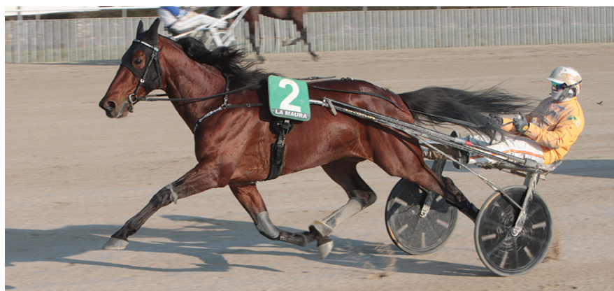
VITRUVIO torna nel Nord Europa dove ha raccolto diverse vittorie importanti