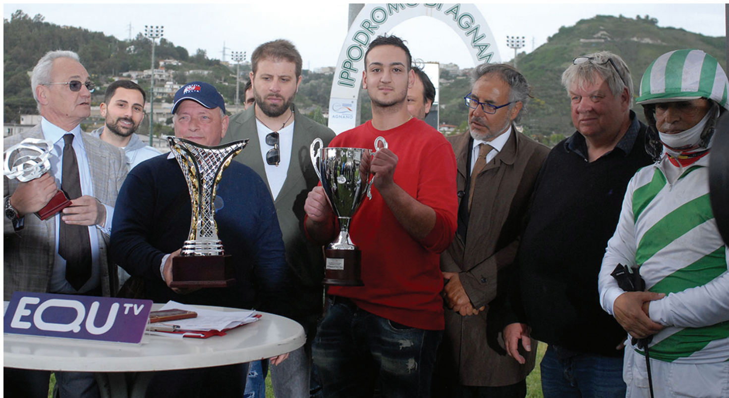
IL TEAM DI BLEFF DIPÀ alla premiazione del Freccia d'Europa, conquistato con merito dal derbywinner 2020