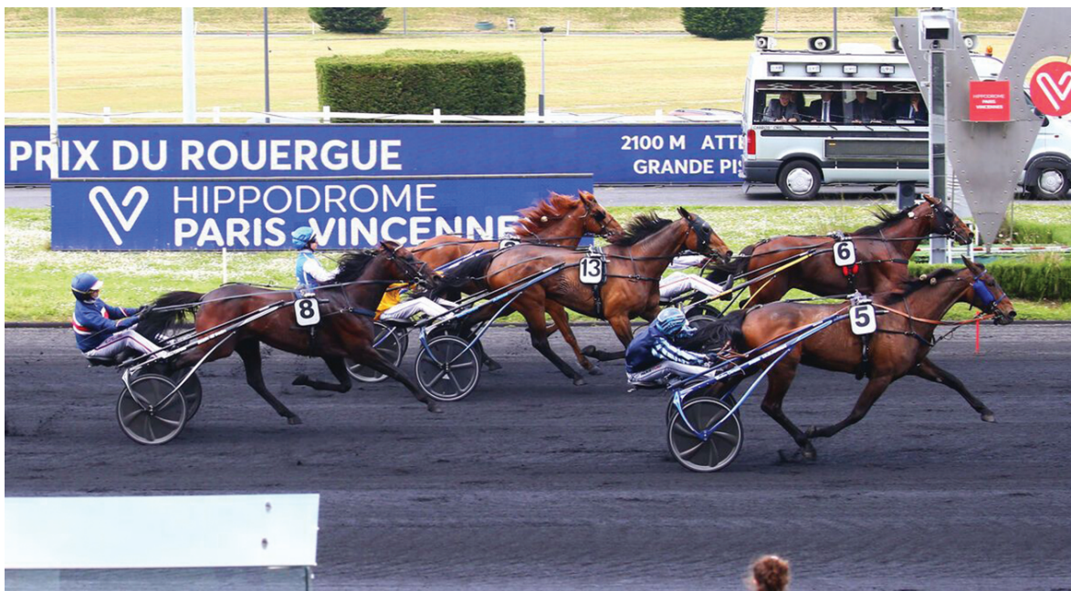
ZACCARIA BAR a segno sabato a Vincennes, nel Prix du Rouergue