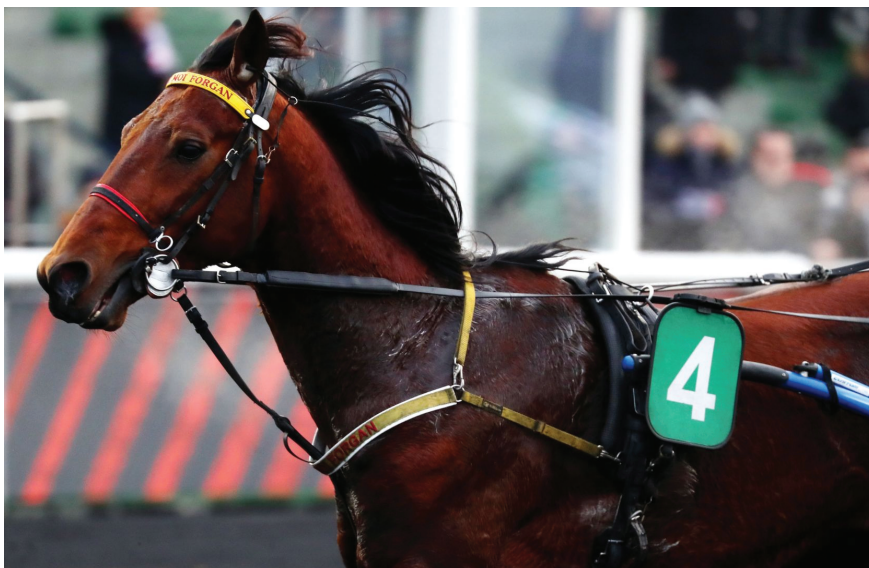
GUIDE MOI FORGAN sarà tra i più attesi nella prima tappa del Grand National du Trot ad Amiens