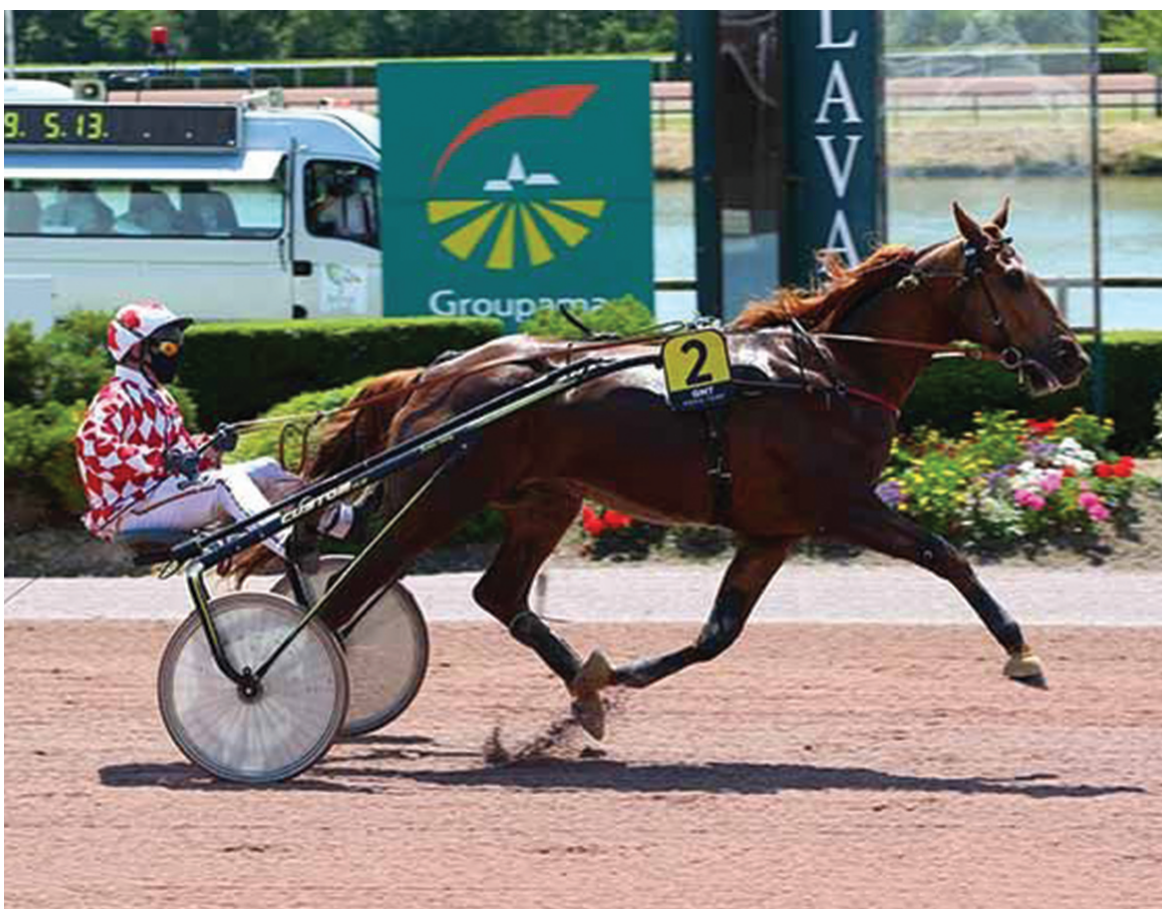
EBARB CRACK MONEY è il vincitore del Grand National du Trot 2021 e mercoledì ad Amiens sarà al via nella prima tappa di quello 2022