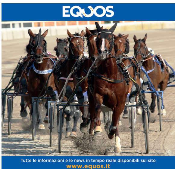
Tutte le informazioni e le news in tempo reale disponibili sul sito www.equos.it