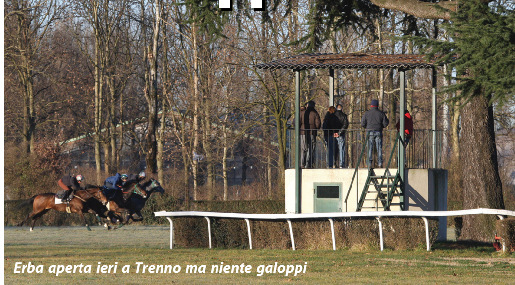
Erba aperta ieri a Treviso ma niente galoppi