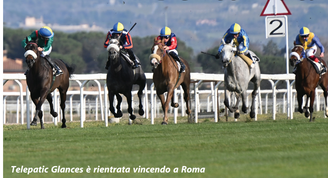
Telepatic Glances è rientrata vincendo a Roma