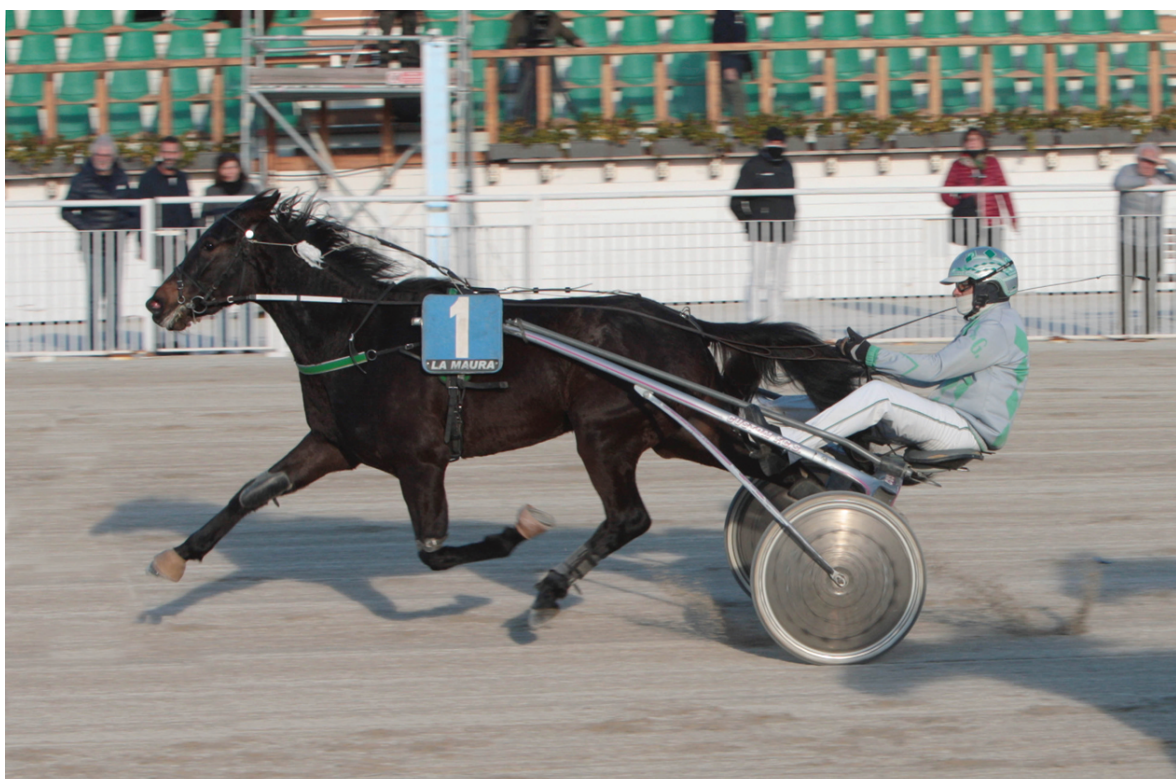
DYNAMITE BAR, sul traguardo del Premio Dalmazia a Milano