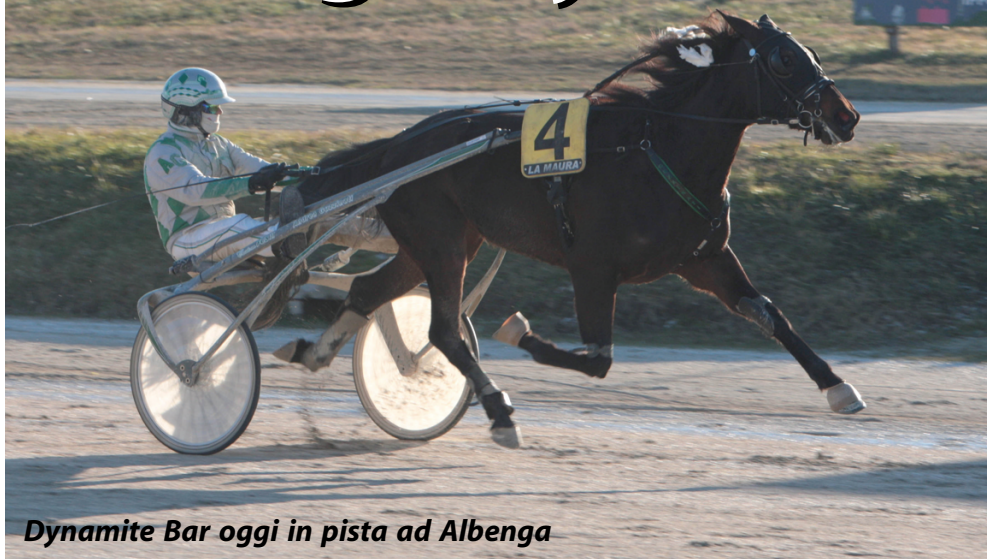
Dynamite Bar oggi in pista ad Albenga