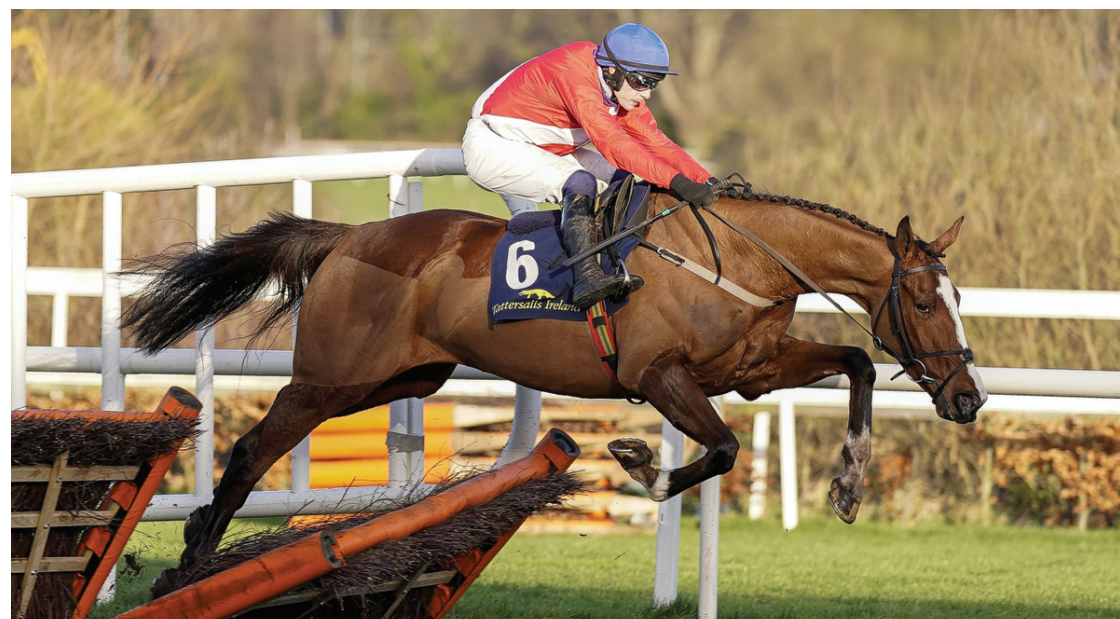
SIR GERHARD è il nettissimo favorito del Gr. I in siepi d'apertura, oggi a Cheltenham

FAVORITI: FASTORSLOW Ganapati, Saint Felicien