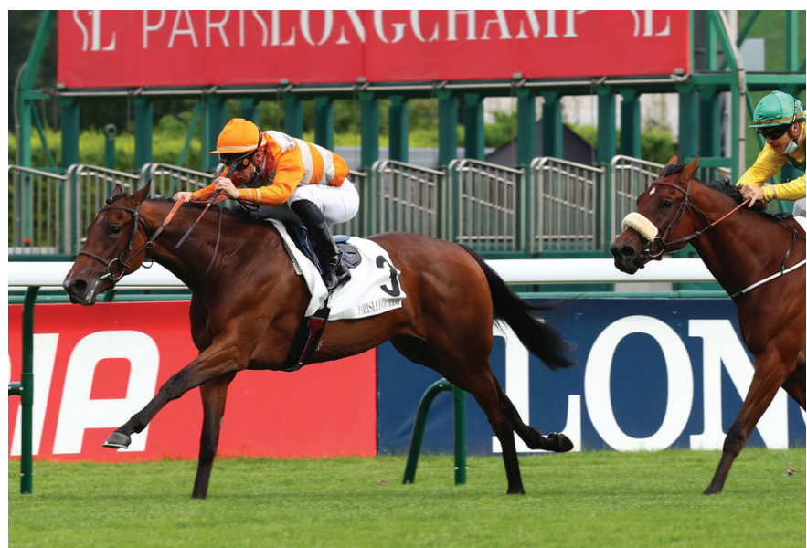
ROSE PREMIUM dopo il buon rientro di Cagnes cerca la prima listed oggi a Chantilly

mero basso di steccato potrebbe consentire a Elliptic di prendersi la rivincita. Le tre peraltro non corrono sole. Starfix (Dabirsim) e Fearless Angel (Belardo) sono le più indicate a mettersi in mezzo, facendo leva sulla condizione già rodada. La seconda listed di giornata è il Prix Monténica (E. 55.000, m. 1300), con dodici candidati. La partita si annuncia apertissima, soppesando la particolarità del percorso, gli steccati, la superficie e la forma non certa di diversi rientranti. Anche se non ha il valeur più alto del campo, potrebbe colpire la marsigliese Rose Premium (Dark Angel), rientrata a Cagnes vincendo in ottimo stile una classe 1 in una situazione