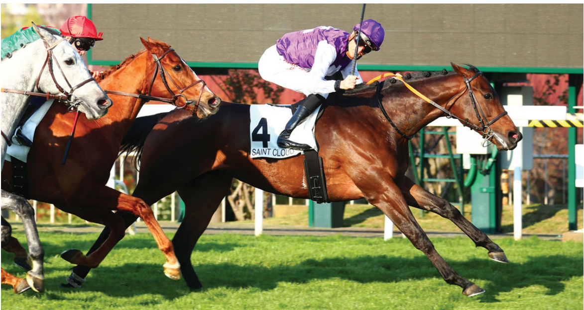
PRETTY TIGER (C.Soumillon) svetta nel Prix Exbury su Hurricane Dream e Skalleti