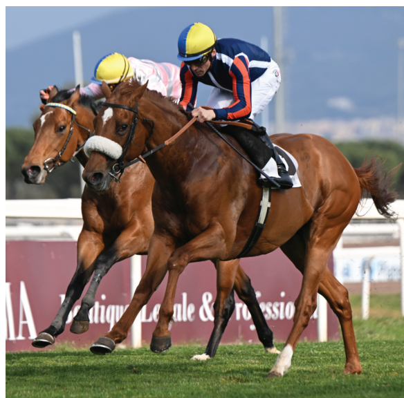
BAHJA DEL SOL (D.Vargiu) passa netto nel Daumier

Sì, ma sarà anche quella di Atamisque che ci è molto piaciuta perché Dario Vargiu è stato saggio sapendo di dare tanti chili e di poter pagare rientro. Ha saggiato la Highland Reel di casa Monaldi (vedrete che farà anche ben più metri) e ai 200, anche con un lievissimo e obbligato cambio di corsia, ci ha dato dentro. Il bel finale tonico le ha consentito di acciuffare Dolce Napoli , che esce benissimo dalla corsa. Se poi rivedete le immagini scoprirete che Prichi è ancora lì a portata di dichiarazione partenti, tradotto non ha mollato del tutto. A noi questo marcatore è sembrato da Regina Elena e lo sarà (e non dimenticate che non ha corso Queen Rouge ). Del resto dal Torricola , di fatto resta per noi una listed, si va alla classica. Prendete nota: Granatina , Intense Battle , Aria di Festa , My Sweet Baby e lo scorso anno la sfortunata ma ora felicemente ricomparsa Telepatric Glances . Tanto per mettere le carte in tavola. Forza che si sogna e quel 1° maggio la Roma giocherà in casa con il Bologna , così vi fate un'idea. MBER