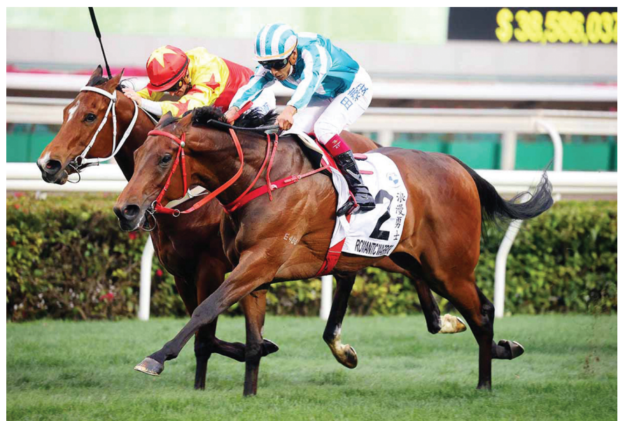
CALIFORNIA SPANGLE, all'esterno, piega Romantic Warrior nell'Hong Kong Derby

Trascuriamo purtroppo nelle nostre note l'Australia, che pure è la nazione dove l'ippica continua a vivere un vero e proprio boom, ma questa volta vale la pena soffermarvisi. A Rosehill, nel New South Wales, sabato si è svolta un super convegno incentrato