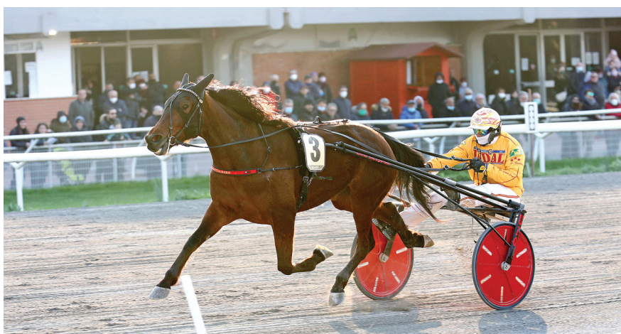
DELICIOUS GAR ha centrato la quinta vittoria in 5 corse in Italia nell'Etruria Femmine PERRUCCI